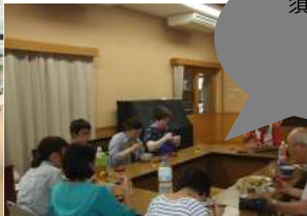
須川での調理の様子